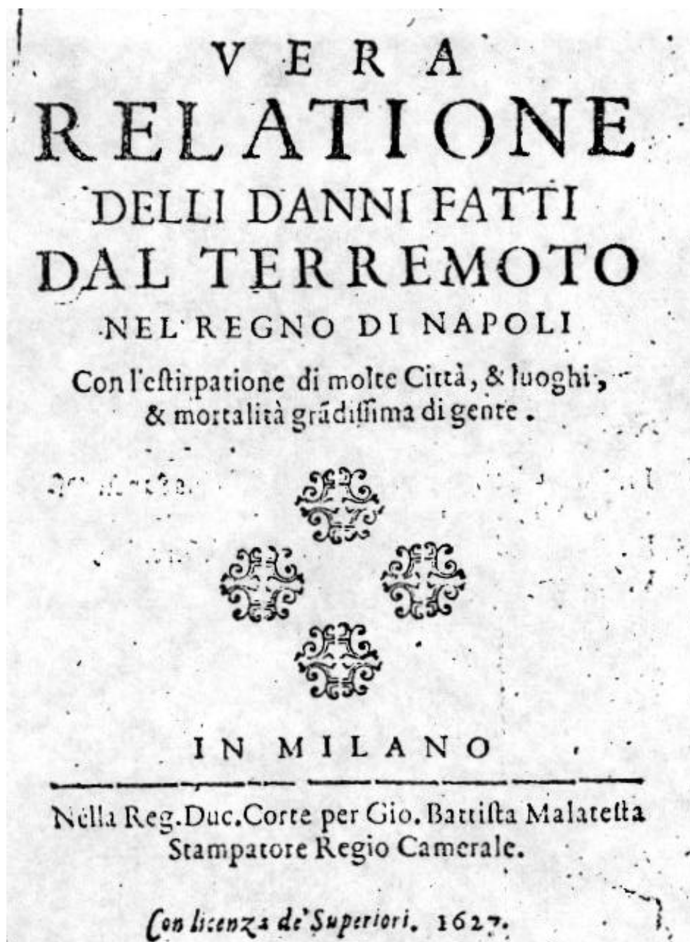
Frontespizio di una relazione anonima sugli effetti del terremoto del 30 luglio 1627

[da E. BOSCHI et al. (1995), Catalogo dei forti terremoti in Italia dal 461 a.c. al 1990 , SGA - Istituto Nazionale di Geofisica, Bologna.]