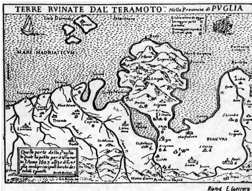
Terremoto del 1627. Anche questa mappa fornisce una descrizione dei danni secondo una scala macrosismica a quattro gradi. [in ENEA (1992), Terremoti in Italia dal 62 a.d. al 1908 , Roma]

Il sisma ha avuto un'intensità massima (complessiva di diverse scosse) dell'XI grado della scala MCS, ha provocato la morte di numerose migliaia di persone, ha causato fratture nel terreno, variazioni nel regime idrico delle acque sotterranee ed